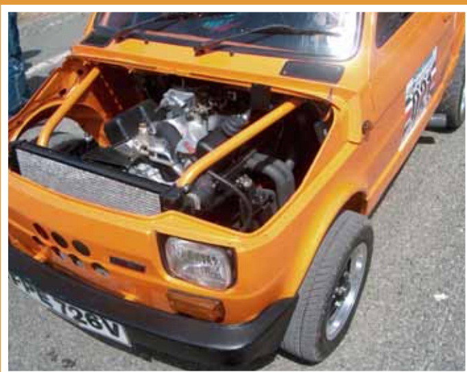
Pompannappi pikkulohkolla. Tällä olisi mukava kerätä omenia puutarhasta.