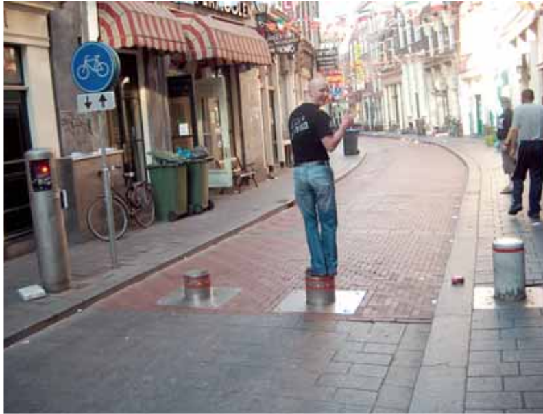
Amsterdammassa puomit oli korvattu hydraulisesti kadusta nousevilla pilareilla ja sehän meitä maalaisia ihmetytti.