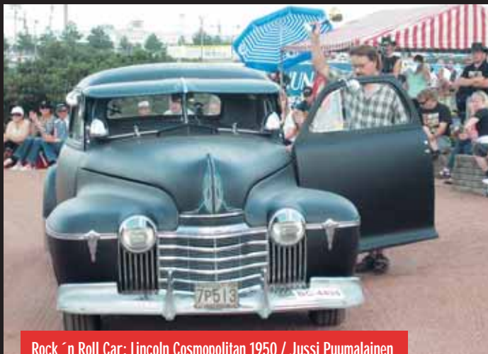
Rock 'n Roll Car: Lincoln Cosmopolitan 1950 / Jussi Puumalainen