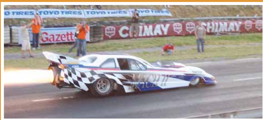
Tämä autoksi naamioitu kuuraketti ei jättänyt ketään kylmäksi.

coffee shopista kyllä saa kahvia, mutta savukkeita ostaessa on syytä pitää varansa tai voi huomata olevansa kahveella sanan toisessa merkityksessä. Me saavuimme Amsterdamiin aamulla yhdeksän maissa ja mielessä oli kahvin lisäksi aamupala. Lähdimme kävellen kiertelemään ja etsimään aamiaispaikkaa keskustasta. Vartin kävelyn jälkeen viereemme pysähtyi paikallinen pitkätukka ja rupesi heti kyselemään, että haluammeko löytää jotain, sillä hän tuntee paikat ja neuvoisi mielellään. Oppaamme käveli mukana korttelin verran ja johdatti meidät ihan kelvolliseen kahvilaan. En edellisiltä reissuiltani muistanutkaan, etteivät nämä kaverit pelkkää kohteliaisuuttaan turisteja auta ja niinpä tämäkin herra toivoi pientä palkkiota vaihoistansa. Vaikka nämä paikalliset laitapuolen kulkijat ovatkin käsi ojossa niin heille kyllä antaa mielellään muutaman euron sillä heiltä saa hyvän