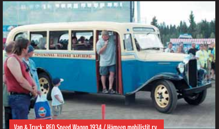
Van & Truck: REO Speed Wagon 1934 / Hämeen mobilistit ry