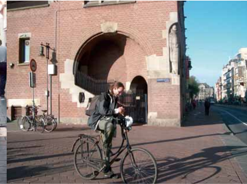
Sertifioitu matkaoppaamme Amsterdammassa.