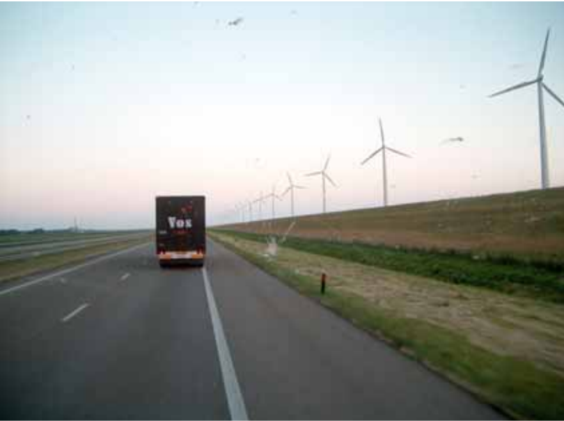
Pohjois-Saksan teillä saa vaikutelman pitkistä välimatkoista.