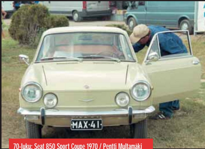
70-luku: Seat 850 Sport Coupe 1970 / Pentti Multamäki