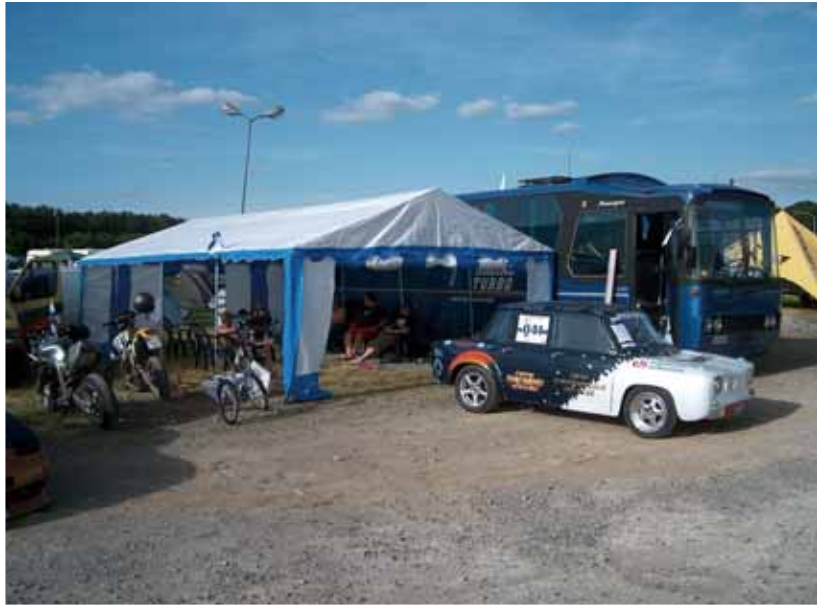
Tilava katos suojasi hyvin paahतालvalta helteeltä.