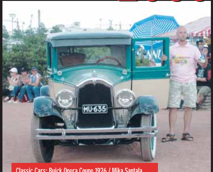
Classic Cars: Buick Opera Coupe 1926 / Mika Santala