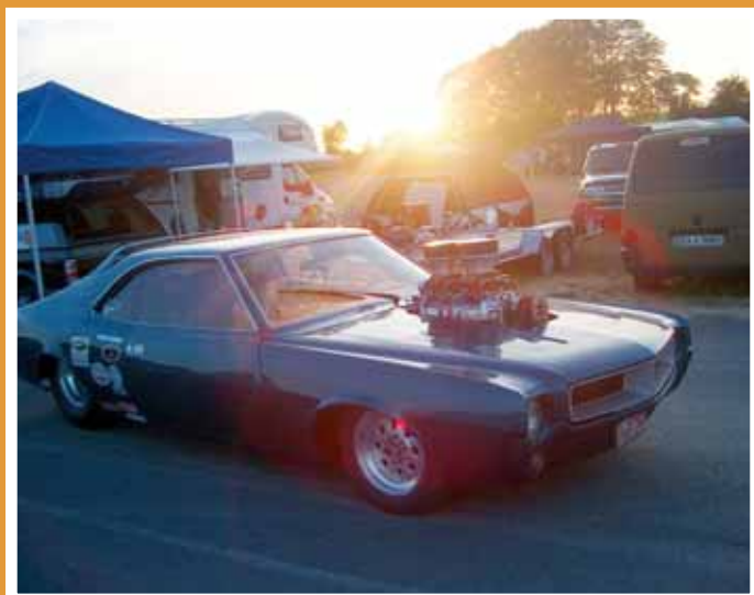
Lomalla on hyvä pysähtyä ihailemaan auringonlaskua.

Tiedoksi niille jotka suuntaavat matkansa Amsterdamiin niin kahvihampaan kolottaessa