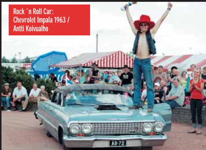
Rock 'n Roll Car: Chevrolet Impala 1963 / Antti Koivualho