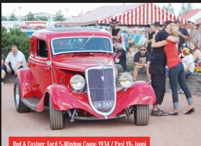
Rod & Custom: Ford 5-Window Coupe 1934 / Pasi Yli-Juoni